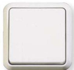
ELSO FASHION antybakteryjny, wyłącznik wzgl. przycisk