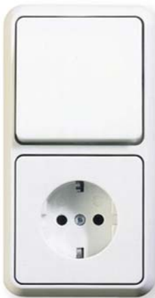
ELSO FASHION antybakteryjny, kombinacja wyłącznika i gniazda wtykowego

W przyszłości dzięki ELSO FASHION antybakteryjny wyłączniki oświetlenia nie będą już roznośicielami chorobotwórczych zarazków.