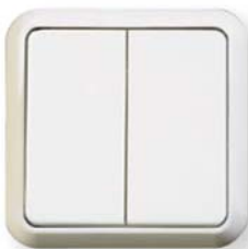
ELSO FASHION antybakteryjny, wyłącznik świecznikowy wzgl. podwójny