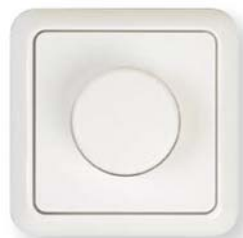
ELSO FASHION antybakteryjny, ściemniacz